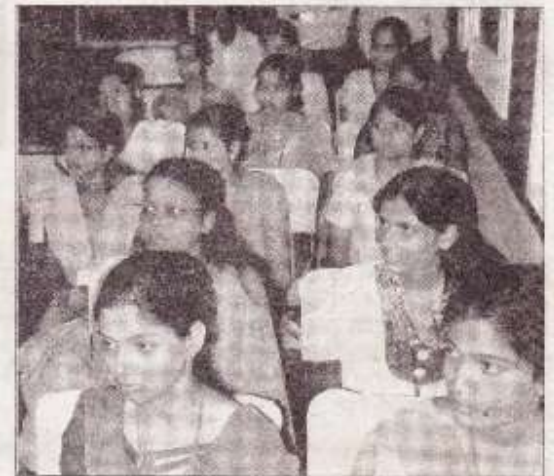
दिल गैलेक्सी में सेलेक्टियल द्वारा आयोजित कार्यशाला को संबोधित करते वक्ता व उपस्थित छात्राए